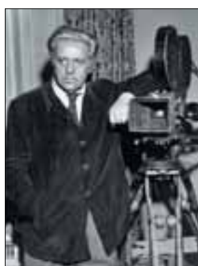
Velkoformátové fotografie pro výstavu "Hugo Hass"