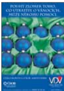
Prosvětlovací interierový panel B1