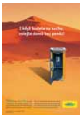
Prosvětlovací interierové panely 1,225 m x 1,755 m