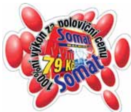
Podlahová grafika s výsekem