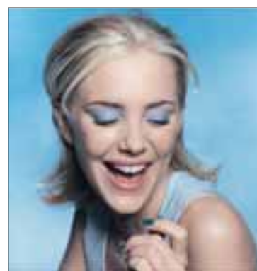
Prosvětlovací panely na prodejní stojan