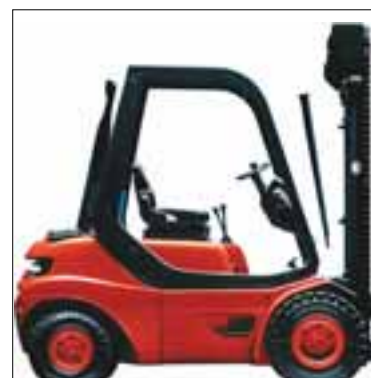
Reklamní polepy pro automobily