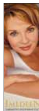
Poutače do výlohy