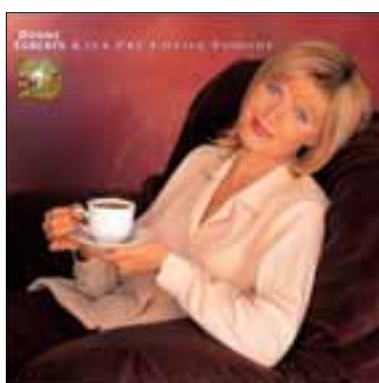
Výmenné motivy pro degustační stánek